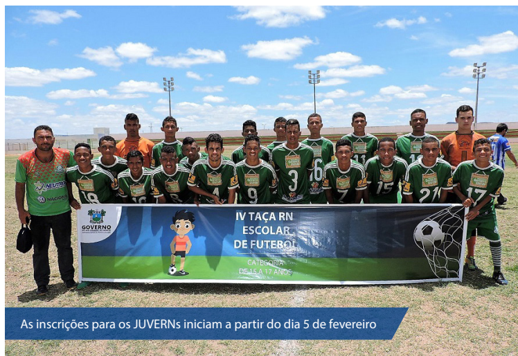
As inscrições para os JUVERNs iniciam a partir do dia 5 de fevereiro

O período das adesões dos municípios e órgãos desportivos que desejam participar dos eventos promovidos pela SEEL já começou através do email: seeventosrn@gmail.com. As inscrições para os Jogos da Juventude Escolar do Rio Grande do Norte (JUVERNs), que durante a gestão