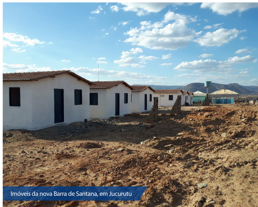
Imóveis da nova Barra de Santana, em Jucurutu