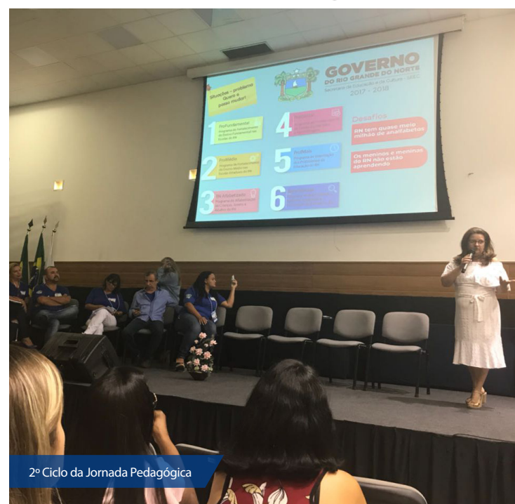
2º Ciclo da Jornada Pedagógica

A secretária participou do segundo dia das jornadas de Pau dos Ferros, Umarizal, Apodi e Caraúbas.