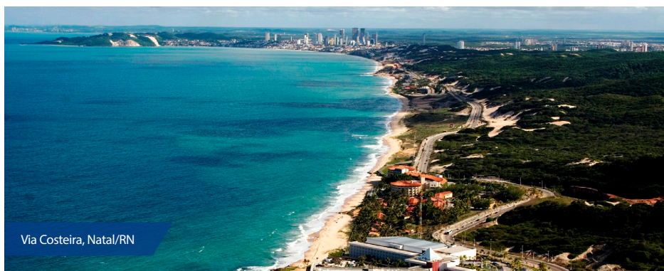
Via Costeira, Natal/RN